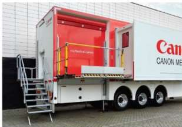
Separate patient access with stairs or lift