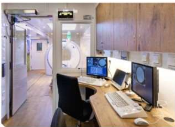
CT Control room