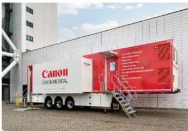
CT City Hopper ready for scanning