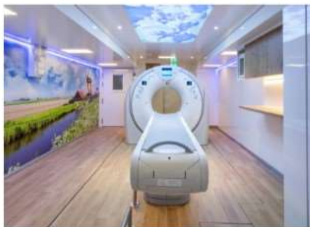
CT-scan area with wall and ceiling art as well as dimmable color-lights